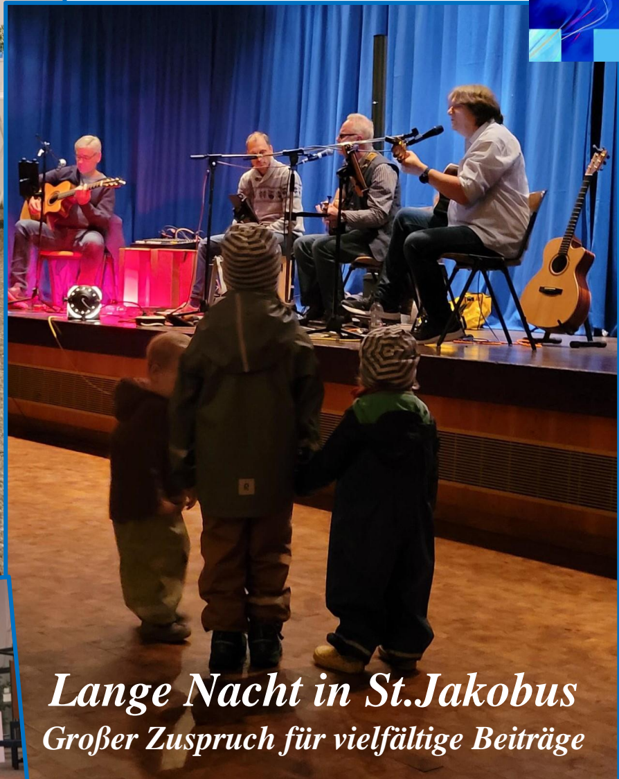
Lange Nacht in St. Jakobus Großer Zuspruch für vielfältige Beiträge