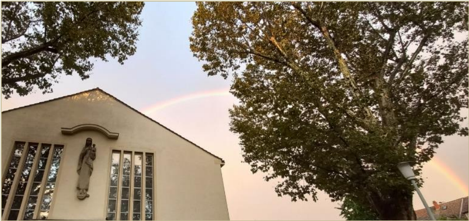
Regenbogen an der Maria Hilf-Kirche