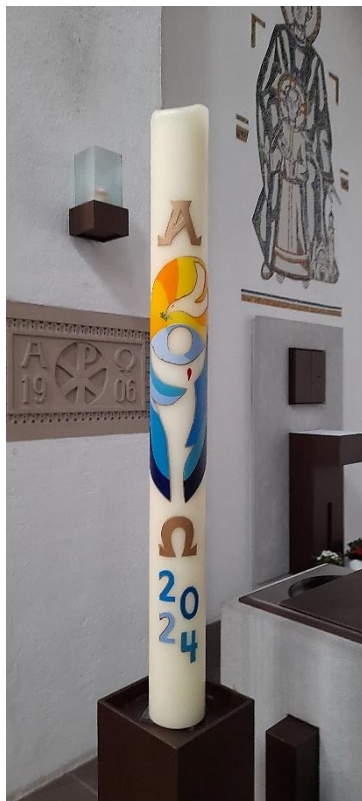
Text und Fotos: Marina König & Patrizia Rzeszutek