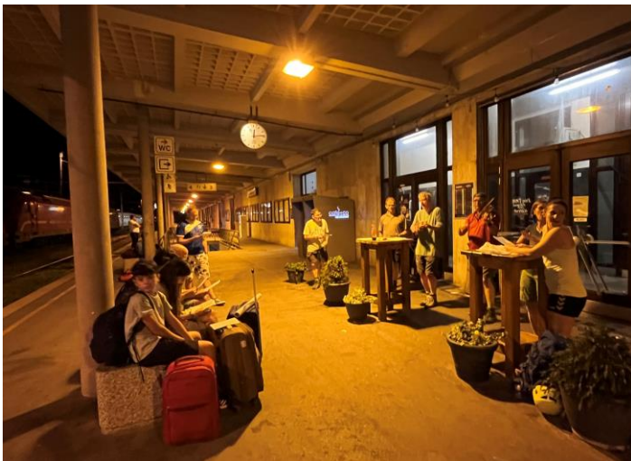
Nächtliche Spontansession im Bahnhof Jesenice mit wartenden Reisenden aus Slowenien, Spanien und Deutschland

Unerwartete Ereignisse gibt es für die Alpenwanderer der Gruppe KJG medium bei ihrer diesjährigen Fahrt einige. Im Vorfeld drohen Mitwanderer wegen Hüftproblemen oder Sportunfällen auszufallen. Am Anreisetag schließlich wirft der Verdacht auf ein Herzthema einen Teilnehmer aus der Wandergruppe heraus. Die Anfahrt nach Slowenien ist im Liegewagen über Nacht gebucht, wenige Wochen vor Reisebeginn wird mitgeteilt: es stehen nur Sitzplätze zur Verfügung. Am Tag der Rückreise: Nächtlicher Bahnhof.