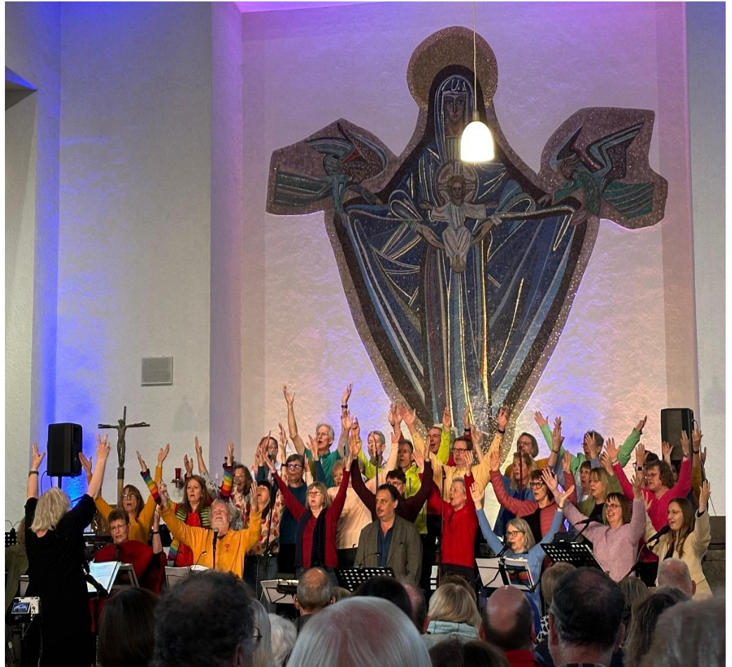
Mitreißend: Jakobus-Projektchor, Auftritt in Maria Hilf

Eine gut gefüllte Kirche als Resonanz auf die Ankündigung eines Musicals, dessen Bekanntheit zumindest im europäischen Raum weit hinter der von „Jesus Christ Superstar“ zurückbleibt, aber 1971 zeitgleich mit diesem entstanden ist. Dies ist Bestätigung und Belohnung zugleich für die Sänger und Sängerinnen des Projektchores „Offenes Singen St.Jakobus“ sowie der Solisten und der Projektband unter der Gesamtleitung von Una Quentin. „Wiederum erfolgreich!“ als Prädikat, wenn man Parallelen zu der vor Jahren mehrfach von einem nahezu identischen Ensemble aufgeführten Rockoper „Jesus Christ Superstar“ zieht. Musikalisch vielfältig hat nun Godspell mit rockigen Liedern und gefühlvollen Balladen die Besucher in seinen Bann gezogen. Und anders als vor knapp 55 Jahren, scheinen solche Kompositionen,