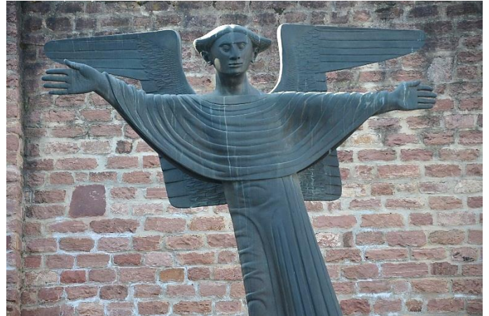
Friedensengel in E6: Mahnmal für die Opfer des Nazi-Regimes und des 2. Weltkrieges

Nach den Gedanken zur Erinnerung und zum Dank war die Mahnung der Geschichte eine weitere Themensetzung im Predigtimpuls. Richard von Weizsäcker hatte 1985 in seiner erwähnten Rede vom Tag der Befreiung davon gesprochen, dass sich nach dem Krieg die Chance ergab, dass Deutschland einen Platz unter den Staaten mit demokratischer Verfassung fand. Es gab schon damals politische Gruppierungen, die meinten, irgendwann solle Schluss mit der Schuldfrage sein. Aber von Weizsäcker sprach nicht von