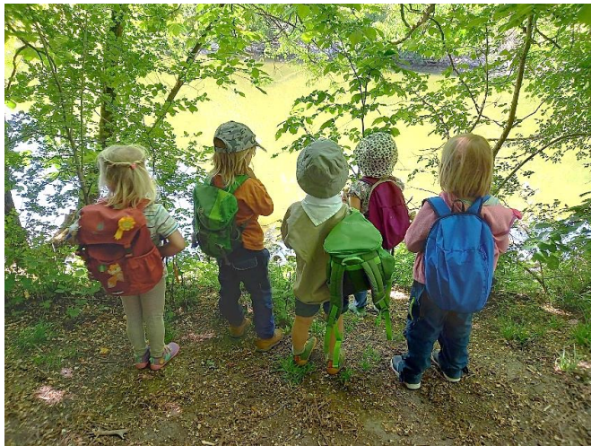
Die jüngsten Pfadfinder beim Erkundungsausflug im Waldpark

Nach einem kleinen Mittagessen ging es auf einen Ausflug in den nahegelegenen Waldpark. Hier sammelte sich jeder einen Stock, mit dem wir einige Spiele spielten, zum Beispiel Mikado. Wir verweilten noch ein wenig am Rheinufer, bevor wir wieder zum Pfadi-Platz zurückkehrten. Hier wartete das Abendessen auf uns. Anschließend durfte natürlich ein Lagerfeuer mit Stockbrot