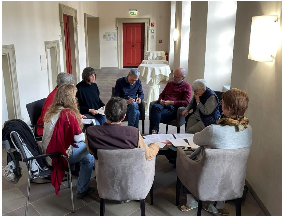
Intensiver Gedankenaustausch in Kleingruppen

Alle gesetzten Anregungen, Impulse und Diskussionen drehten sich fortan um dieses Phänomen. Wie lässt sich also „Selbstverständlichkeit“ erfassen? Sind es konkrete Vorannahmen, was man von Handlungen, Situationen und Gegebenheiten erwarten kann und erwarten darf? Haben diese Vorannahmen ggf. einen für ein soziales Miteinander förderlichen Geltungsanspruch? Welche Handlungen kann ich für mich oder für die Gemeinschaft ableiten? Was begründet meine Handlungen vor dem Hintergrund einer angenommenen Selbstverständlichkeit? Tiefschürfende und an eigenen Selbstverständlichkeiten kratzende, mitunter auch quälende Fragen, die in unterschiedlichen Gruppen-