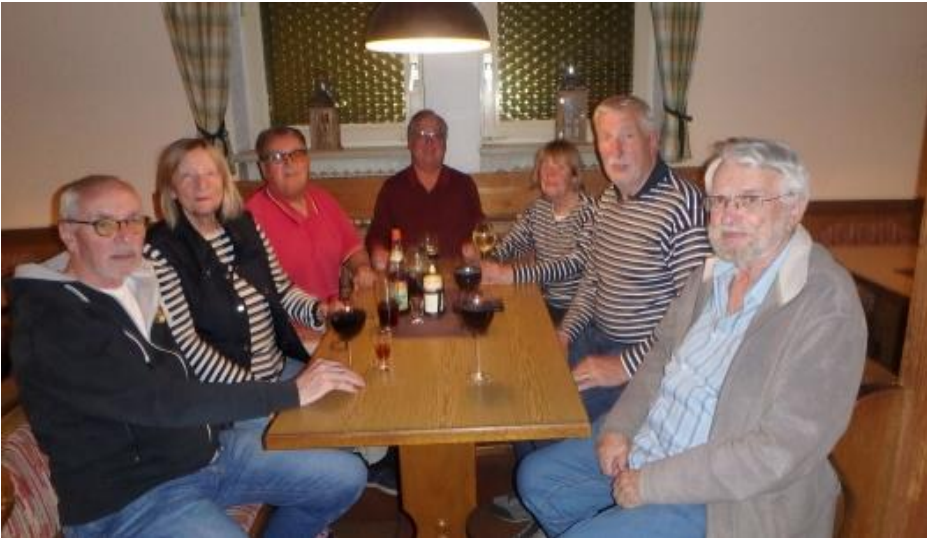
Kolpingfamilie gemütlich in der Osserstube

Montag, der 8. September war unser Anreisetag. Wir bezogen unsere Zimmer in der Kolpingferienstätte Haus Bayerischer Wald in Lambach. Nach dem Abendessen trafen wir uns zu einem gemütlichen Hock mit Besprechung des Wochenprogramms in der Osserstube der Ferienstätte.