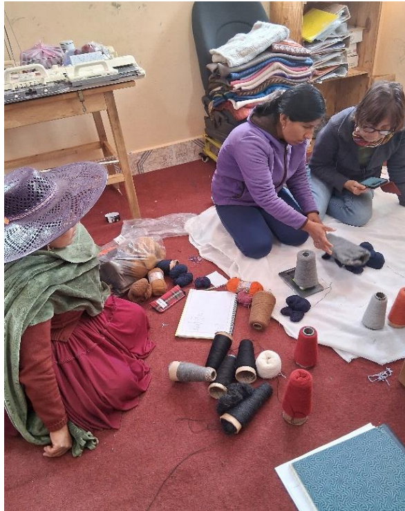
Ein Entwurf der Strickerin wird besprochen

Im Strickraum kommen die gelernten Strickerinnen zusammen und arbeiten, wenn sie Zeit haben. Manchmal ist auch das Kind dabei, wird gestillt oder beschäftigt sich. Wir konnten einige Alpaka-Pullover mit