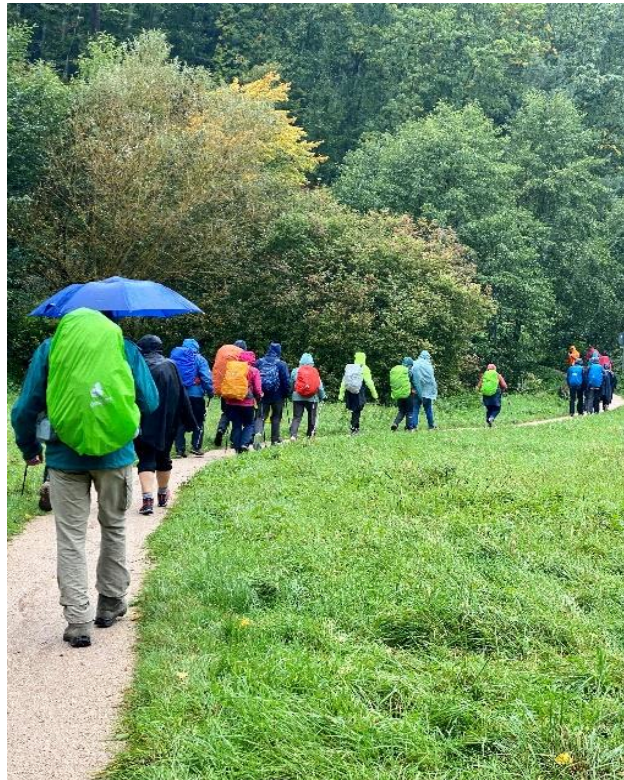
Sturm und Regen: das Wetter schlug Kapriolen

Bevor wir unser Tagesziel Ettlingen erreichten, richtete sich der Blick auf den „sehnsuchtsvollen Menschen“ – auf das, was uns im Leben antreibt,