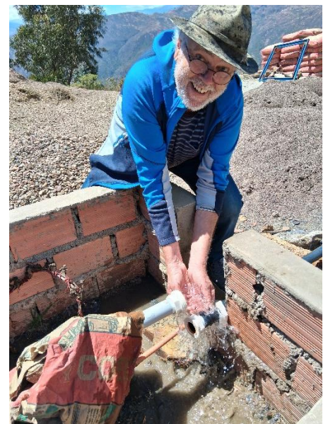
Kürzlich wurde der Brunnen zur Bewässerung in Betrieb genommen. Der Autor dieses Berichts freut sich.

Spenden für das CCA können überwiesen werden an: Freundeskreis INTI Ayllus, IBAN DE46 6439 0130 0626 6240 02 bei der Volksbank Schwarzwald- Donau-Neckar, Stichwort CCA. Geben Sie bitte Ihre volle Adresse an, wenn Sie eine Spendenbescheinigung möchten.