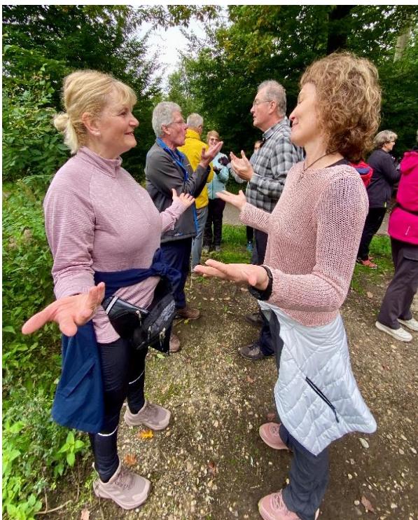
Heitere Stimmung beim Lach-Yoga