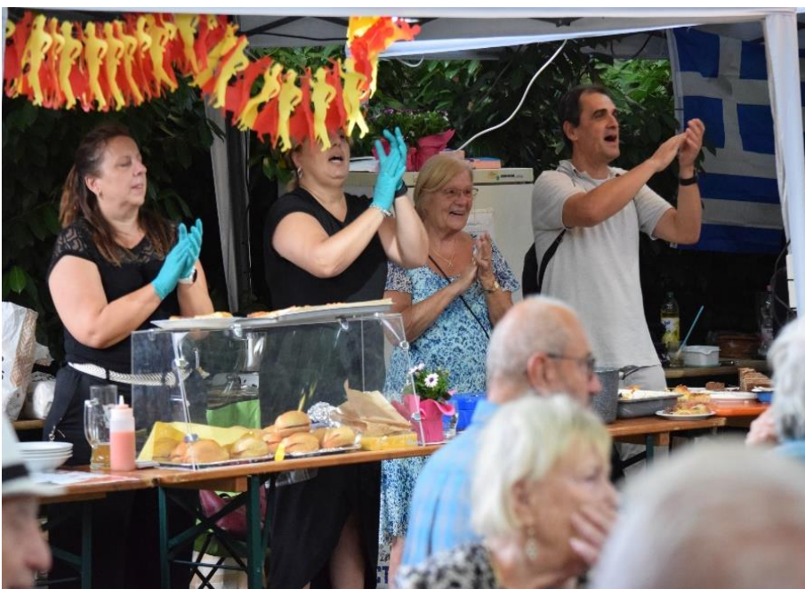
Auch am Essensstand wurde begeistert mitgefeiert.