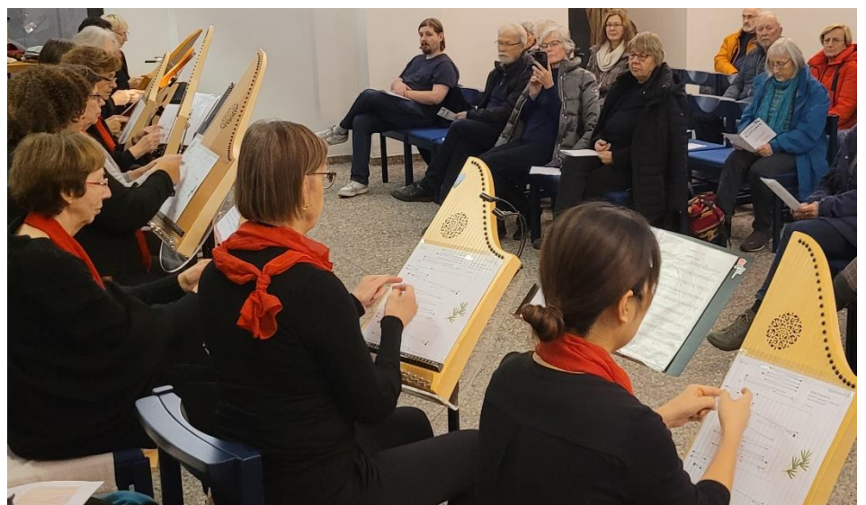
Veeh-Harfen erklingen von Si Musica