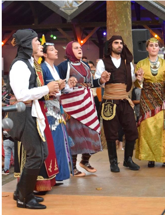
Wieder freudig erwartet: der Auftritt der Tanzgruppe vom Verein der Griechen aus Pontos

Auch über die Speisenangebote der Kulturgruppen wurden vermeintliche Grenzen überwunden. Zum Teller mit den bulgarischen Spezialitäten gab es obendrein das Rezept und Kochtipps verbunden mit der Bitte,