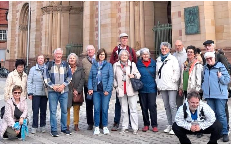
Gruppenfoto vor dem Speyerer Dom