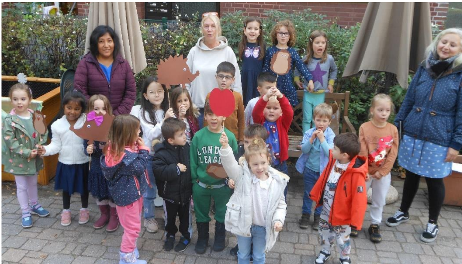
„Magisches“ Stammeslager der Pfadfinder